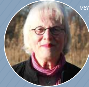
Graddie - heeft moeite met lezen en schrijven

'Een patiëntportaal geeft mij vertrouwen. Het helpt me om meer te weten te komen over mijn gezondheid en behandeling in het ziekenhuis. Als ik dat weet, durf ik ook sneller vragen te stellen aan de dokter!'