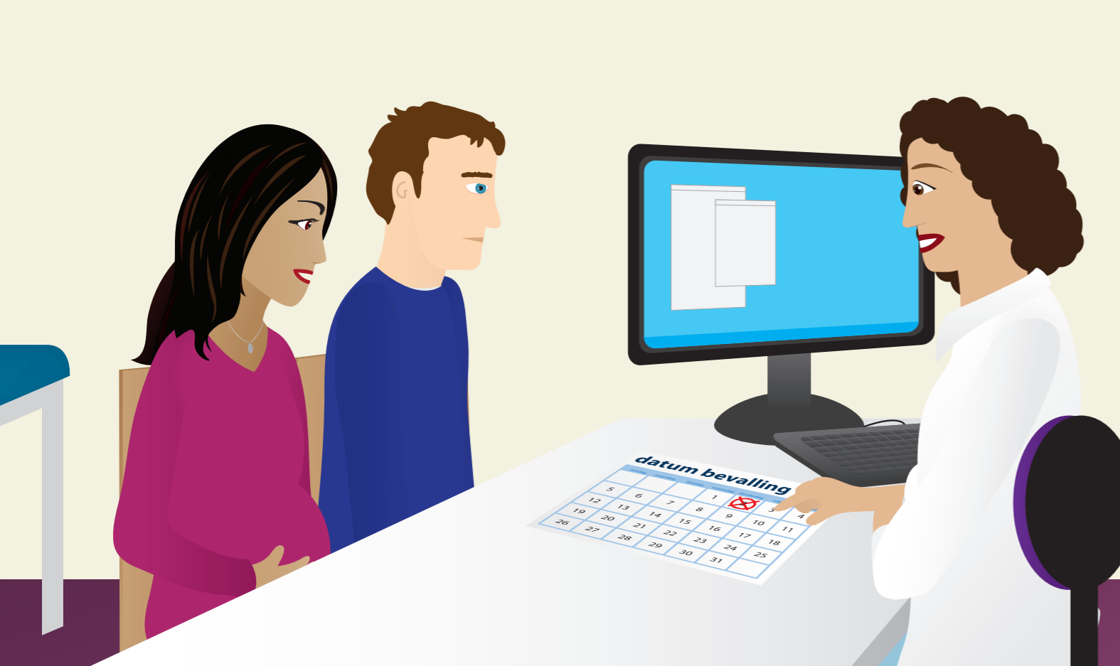
Ze praten over de bevalling